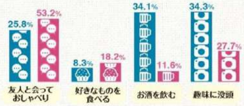
一般社団法人中央調査社「ストレスに関する意識調査」(2008)