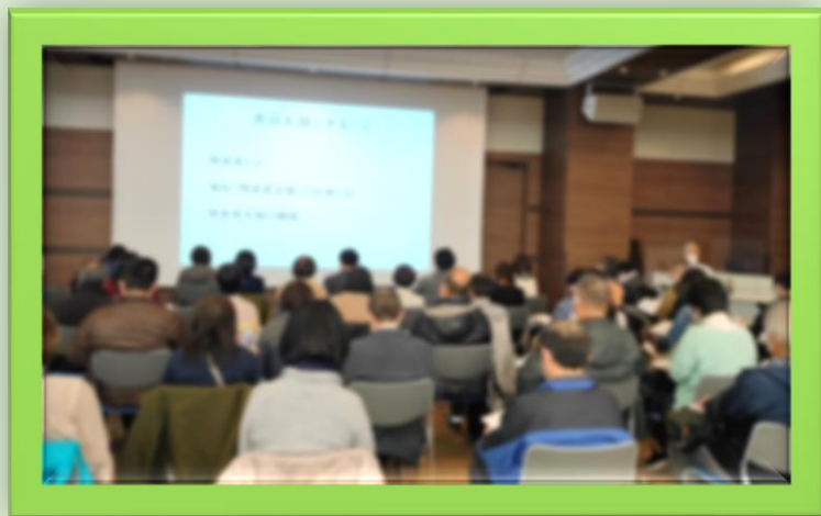
第1部「ふくしの仕事 はじめてセミナー」