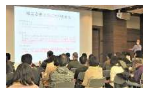
「ふくしの仕事 はじめてセミナー」

2月25日(日) 区民・産業プラザ Coconeri ホールにおいて、練馬区内で介護・障害福祉サービスの仕事に就きたい方や興味のある方を対象に、人材確保のイベントを開催しました。第1部の「ふくしの仕事 はじめてセミナー」では40名が参加され、仕事の魅力、やりがい、求められる人材等について講師が丁寧に解説してくださいました。その後開催された第2部「相談・面接会」には、セミナーからの参加者を含めて58名が参加され、活気ある相談・面接会となりました。事業者の皆様の人材確保のお役に立てるように、研修センターでは次年度も引き続き各種イベントを開催いたしますので、ぜひご活用ください。